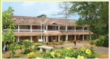
Ayurvedic Hospital & Research Centre, Aluva (Tel. No. 0484 2839076)